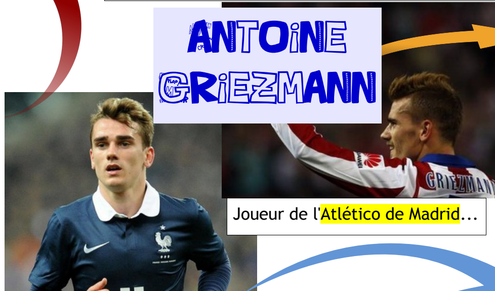
Joueur de l'Atlético de Madrid...